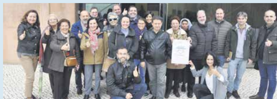
Los asistentes participaron activamente en la jornada.

Después de un descanso, llegó el turno de trabajo. La puesta en marcha