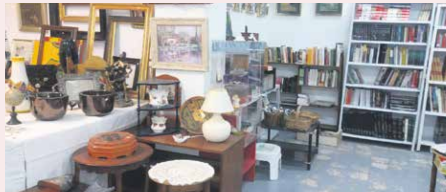
El rastrillo sirve para colaborar con los misioneros diocesanos en tierras de misión.

Edición de otoño de este rastrillo para colaborar con la actividad de los misioneros diocesanos, organizado por la delegación episcopal de Misiones. Abierto los días 23, 24, 25 y 30 de noviembre, y 1 y 2 de diciembre. Horario de 11.00 a 13.30 horas y de 17.00 a 20.00 horas. Los viernes 23 y 30, solo en horario de tarde. Edificio 'MM. Carmelitas' (Paseo María Agustín, s/n, bajos). Más información en zaragozamisionera.blogspot.com .