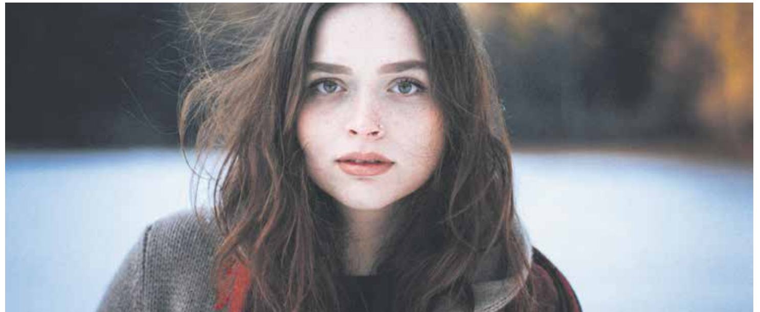
El joven vive la gran aventura de convertirse en adulto, y en ese proceso se juega la mayor toma de decisiones de su vida.

El joven vive la gran y difícil aventura de convertirse en adulto, de madurar, y en ese proceso se juega la mayor toma de decisiones de su vida. Unas decisiones que marcarán definitivamente su vida; unas decisiones en las que se juega su felicidad. En esta aventura de madurar y de responder a sus anhelos más profundos, Jesús se hace el encontradizo. En ese caminar de los jóvenes, en ese proceso de crecer, la Iglesia ha de descubrir la forma de hacerse la encontradiza por medio de verdaderos acompañantes que con respeto y libertad, con formación y entrega, con paciencia y tesón, con oración y acción sean capaces de interpelar al joven para descubrir el proyecto de Dios en su vida viviendo en clave de discernimiento.